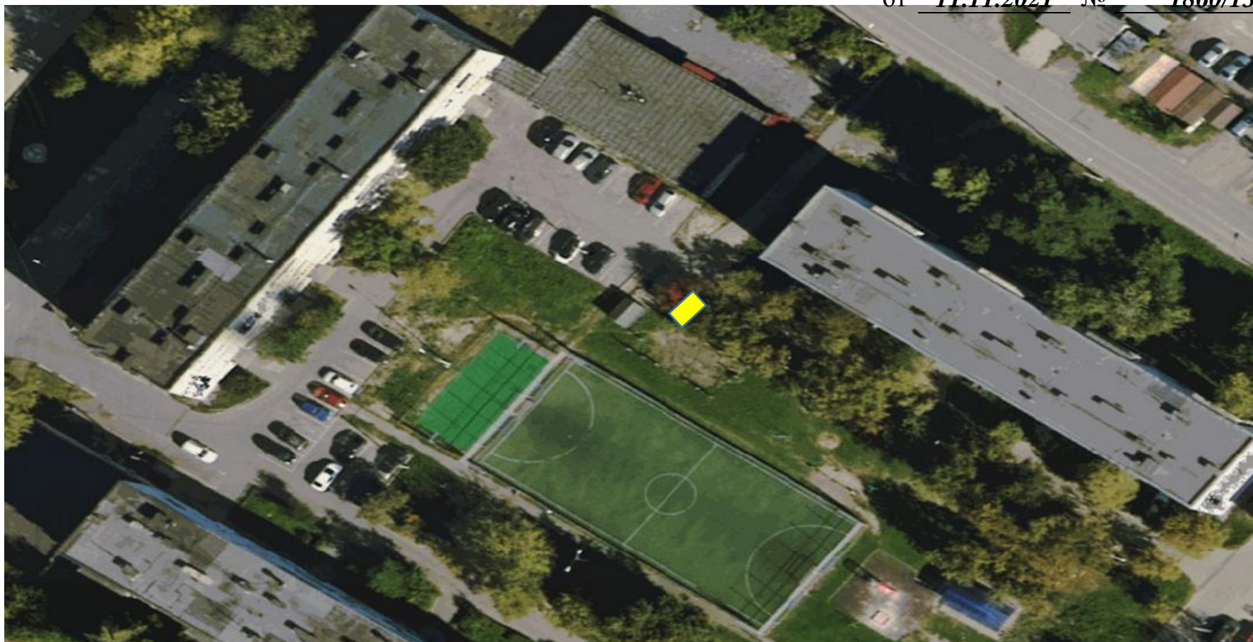
Некапитальный объект «Гараж». г. Чехов, ул. Гагарина, вблизи д. 98 (вблизи земельного участка с КН: 50:31:0040116:179)