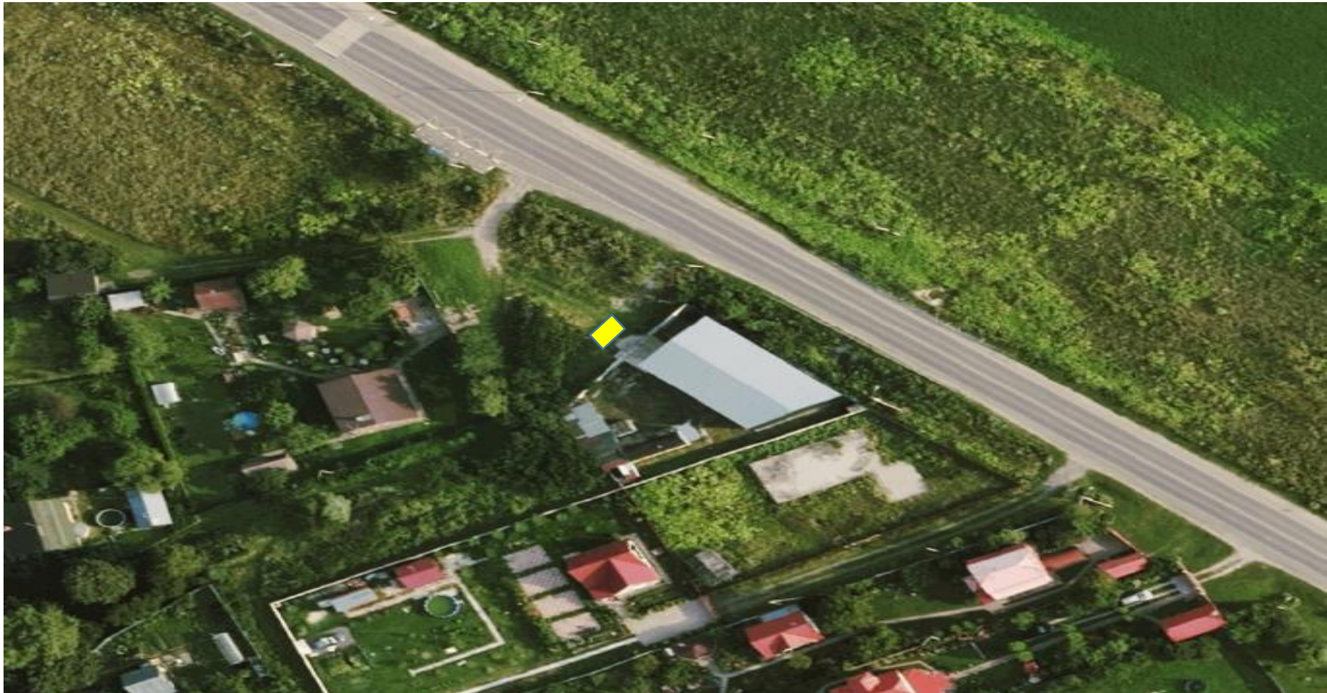
Аварийный некапитальный объект «Хозяйственная постройка». г.о. Чехов, д. Перхурово, вблизи участка 64а (вблизи с земельный с КН: 50:31:0060225:708)