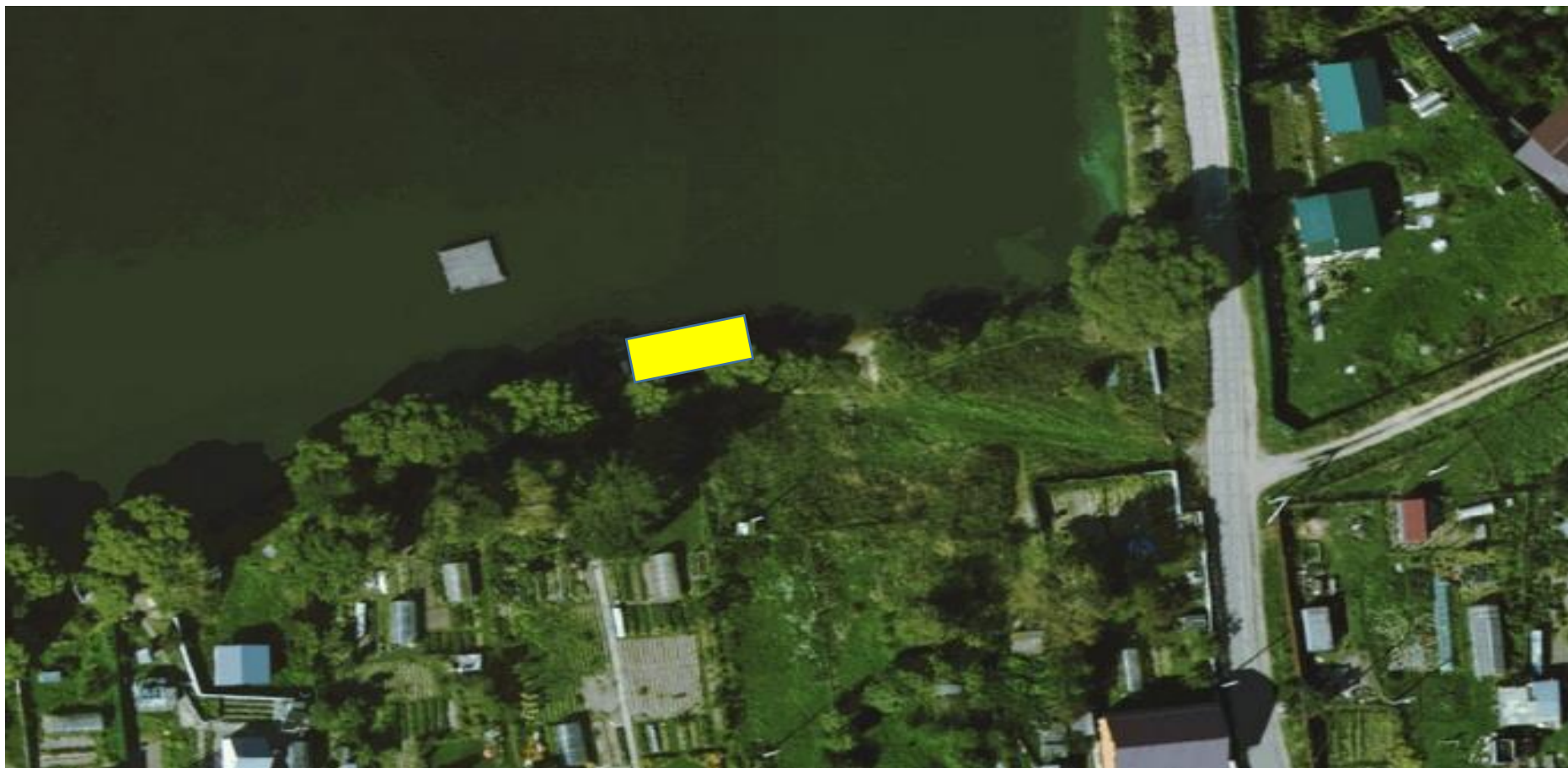
Некапитальный объект «Хозяйственная постройка из металла и причал». г.о. Чехов, д. Ишино (вблизи земельного участка с КН: 50:31:0010104:931)