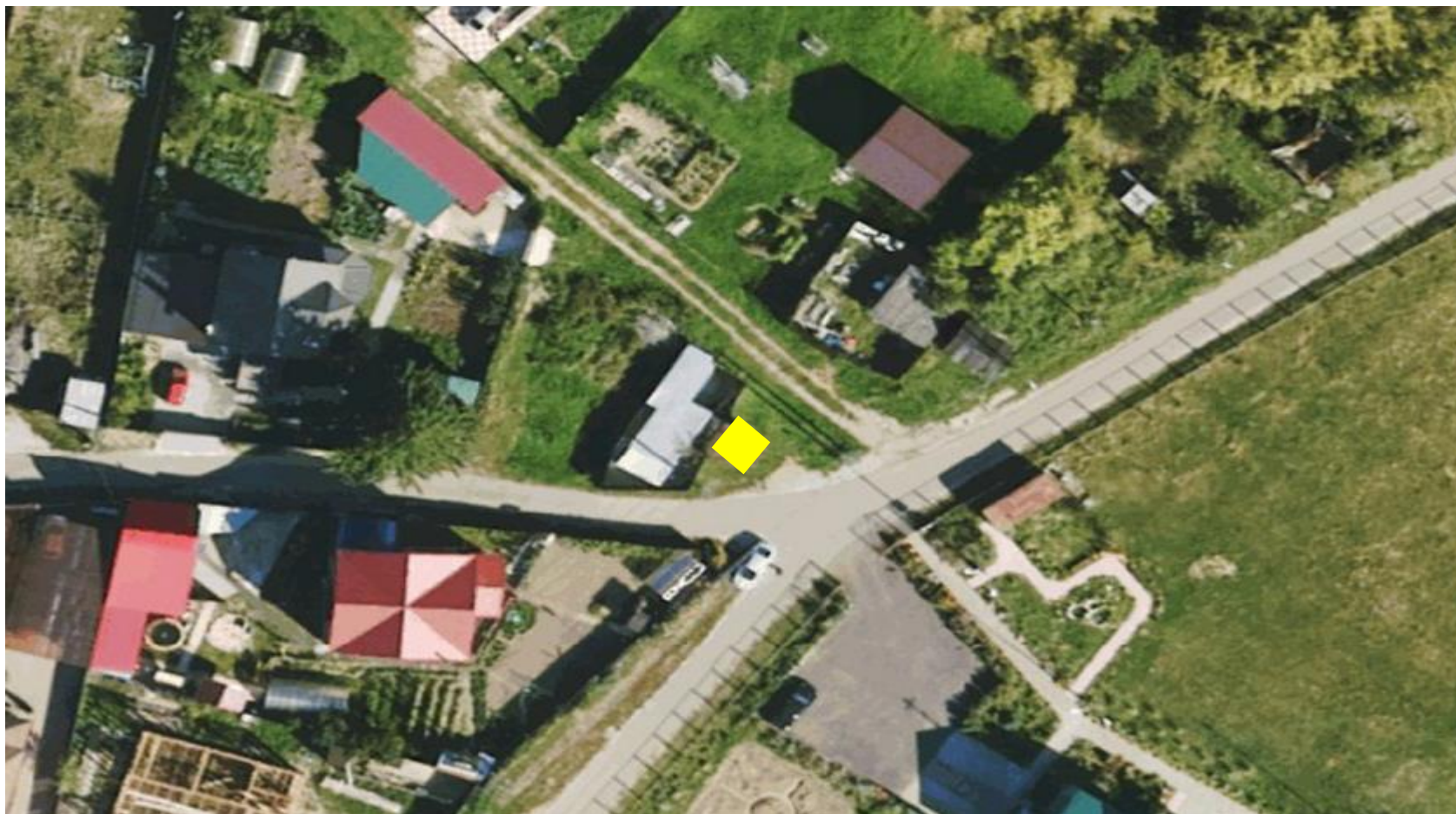
Некапитальные объекты «Хозяйственная постройка из металла». г.о. Чехов, п. Любучаны, ул. Парковая, вблизи участка 21 (вблизи земельного участка с КН: 50:31:0030414:3680)